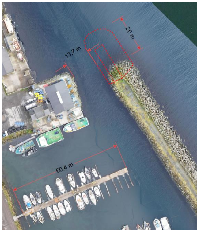
Uppskot frá ráðgeva

Umsitingin hevur fingið ráðgeva at hyggja nærri at bátahylinum, um hvat kann gerast fyri at betra um umstøðurnar. Víst verður á, at við at leingja og smalka molan/brimgarðin á bátahylinum, fer tað at bøta munandi um umstøðurnar í bátahylinum.