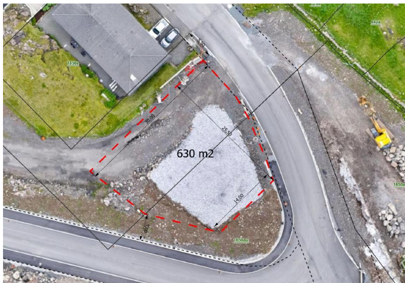
niðan Horn 48