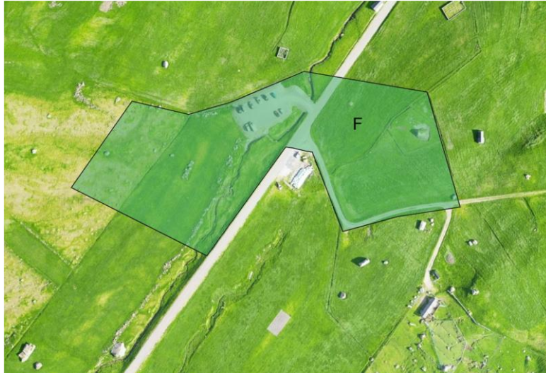
Nýtt F-øki dagf. 12.03.25