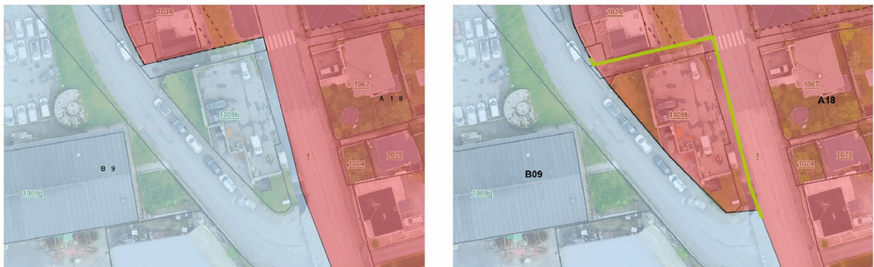
Frá vinstru: galdandi byggisamtykt og broytingaruppskot.

Broytingin umfatar hesar nevndu matr.: 1009a, 1009b og t.