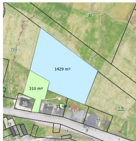
Matrikulviðurskipti eftir umskipan