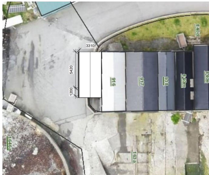
Staðsetan av neysti

Fundur var við umboð fyri Havsvimjarafelagið og Saunagos um støðuna við bygging av skiftingarrúmi í nov. 2022. Tekningar av støðumynd og av bygningi vórðu vístar, og tóku umboðini væl ímóti uppskotinum.