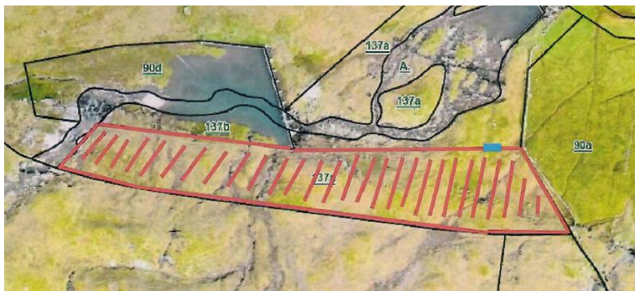
Skitsa, inngirt økið

Í samband við ætlanina um at gróðurseta rundan um svimjihylin í Svínoy varð áheitan send hagastýrinum fyri Hagan Handantúnstriðingur fyri norðan ána í Svínoy um at vetrarfriða ein part av matr.nr. 137a. Hagafundur var 3. mai 2024, og avgjört var, at kommunan keypir bit av matr.nr. 137a.