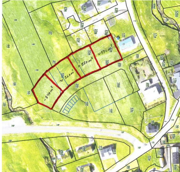
Útstykkning sambært skjal I (viðgjørt á fundum í okt/nov. 2023)

Við hesum metir Tekniska Fyrisiting vera klárt at fara undir sundurbýti av matr.nr. 20i til grundøkir útfrá niðanfyri vísu ætlan. (skjal I)