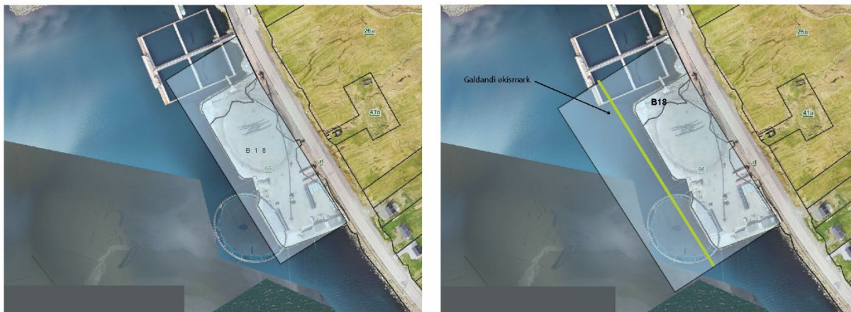
Frá vinstru: galdandi byggisamtykt og broytingaruppskot.

Broytingin umfatar nevndu matr.: 66, Ánirnar.